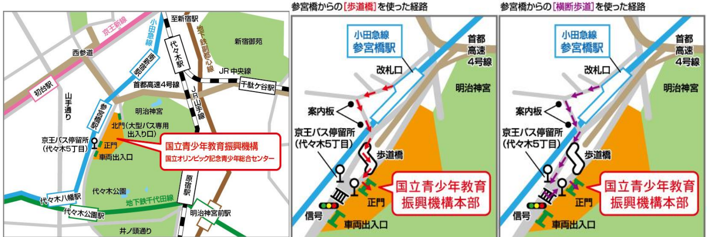
< センター周辺地図 >

※地下鉄千代田線でお越しの際 代々木公園駅下車 徒歩約 10 分 (代々木公園方面 4 番出口)