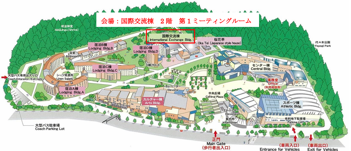
< センター内マップ >